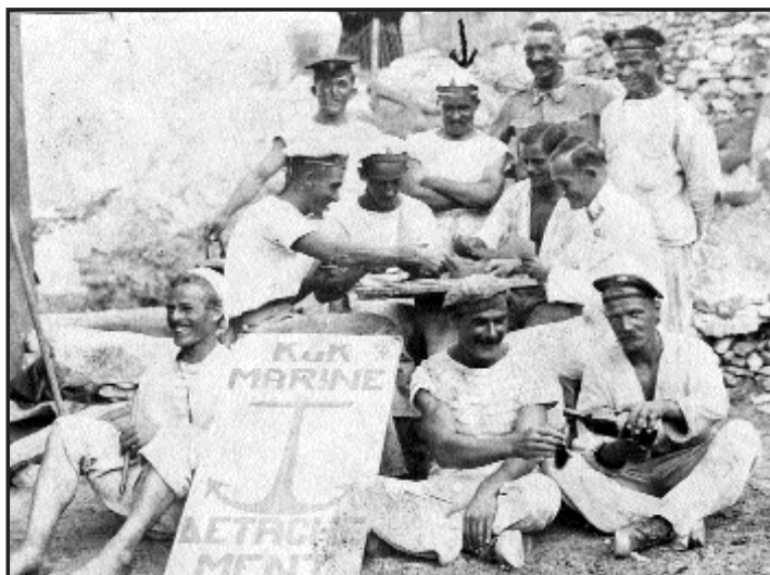
Apám baráti köre az Adriai-tengeren 1917. VIII. 17-én

Apám 1917. október 10-én szabadságot kapott volna, hogy engem – aki akkor 5 hónapos voltam – láthasson. Előtte való napon még szolgálatban volt, s tengeri aknákat szedtek össze, hogy azokat hatástalanítsák. Az egyik akna hatástalanítás közben felrobbant, s a legénység valamennyi tagja – így apám is – szörnyethalt.