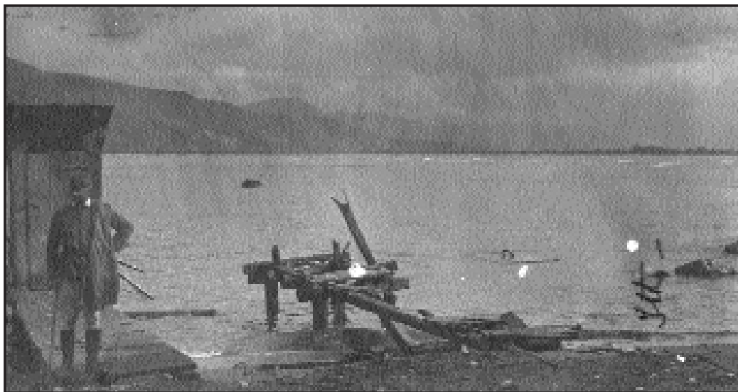
Itt robbant fel az a tengeri akna, amelynek szétszedése volt apámnak és társainak a feladata

[Az aláírás részben olvashatatlan. – a szerk.]